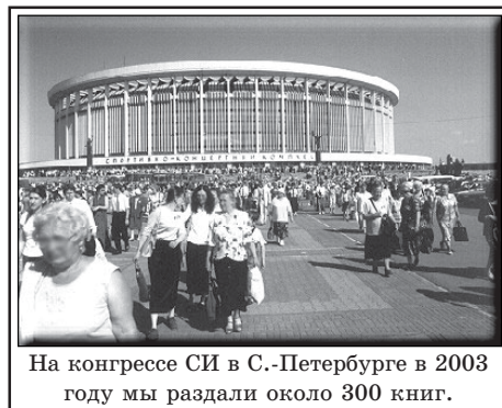
На конгрессе СИ в С.-Петербурге в 2003 году мы раздали около 300 книг.

1 Есть только один Бог (Втор. 4:35, 39, 6:4, 32:39; Ис. 43:10-11; Иак. 2:19).